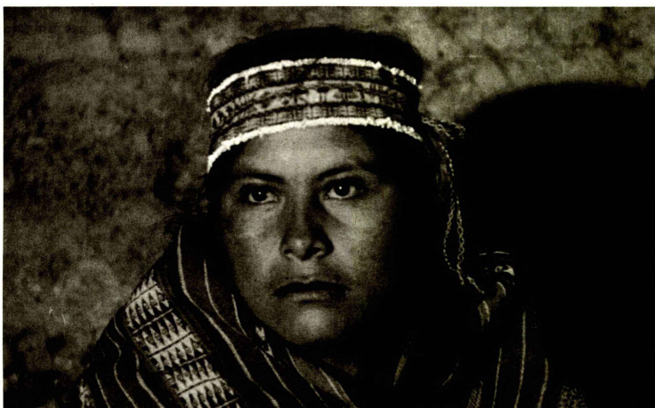
Kritik am amerikanischen Imperialismus: Der Film «Yawar Mallku» aus Bolivien war einer der ersten Filme, die am Fiff liefen.

Auch in der grundsätzlichen Funktion von Filmfestivals haben sich die Ansprüche verändert, wie Programmleiter Thierry Jobin erklärt: «Es gibt heute mit den Streaming-Diensten im Internet ein Überangebot. Unsere Rolle wird in Zukunft noch viel stärker darin bestehen, zu kuratieren», sagt Jobin. «Wir sind der «Guide Michelin» des Kinos.»