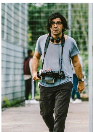
Fatih Akin

La carte blanche sans concession du réalisateur primé à Berlin, Cannes et Venise