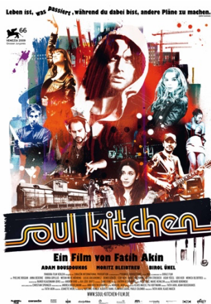
Soul Kitchen (Fatih Akin, 2009)