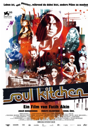
Soul Kitchen (Fatih Akin, 2009)