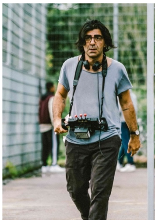
Fatih Akin

In seiner Carte blanche macht der deutsche Regisseur, dessen Filme in Berlin, Cannes und Venedig ausgezeichnet wurden, keine Zugeständnisse